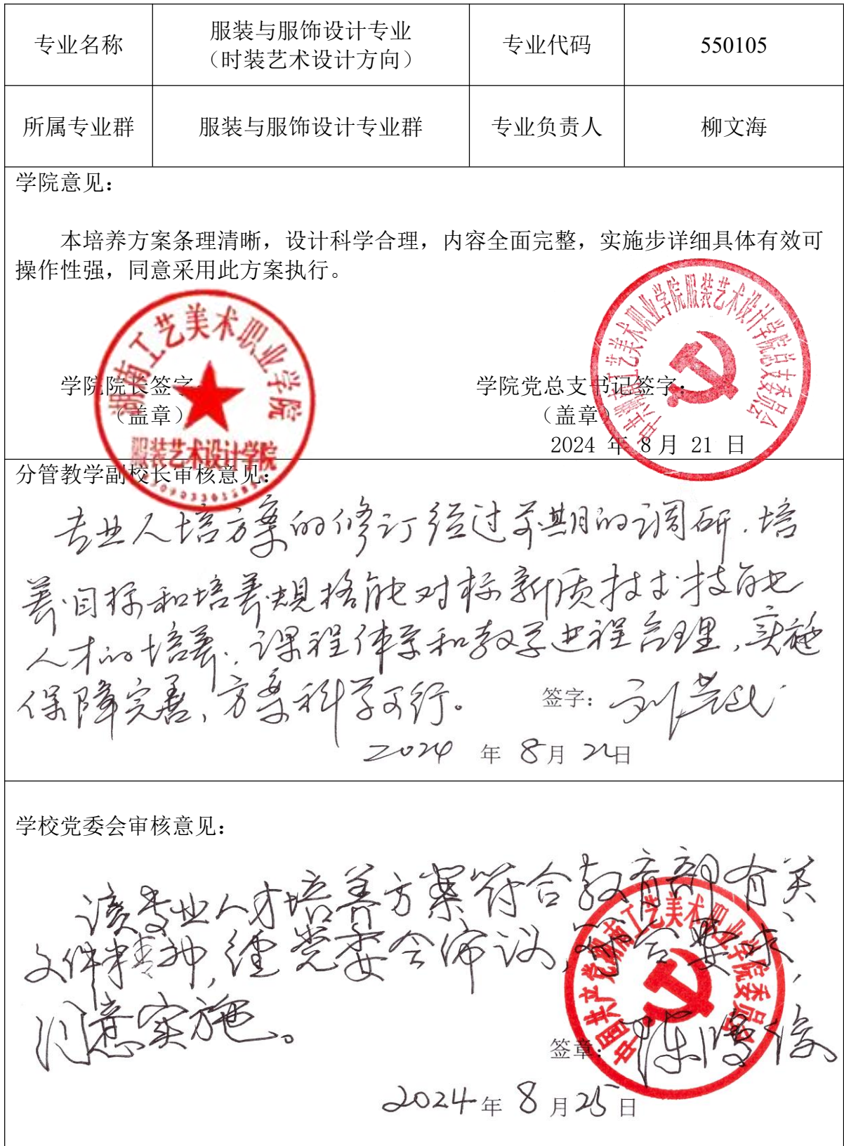
人才培养方案审批表